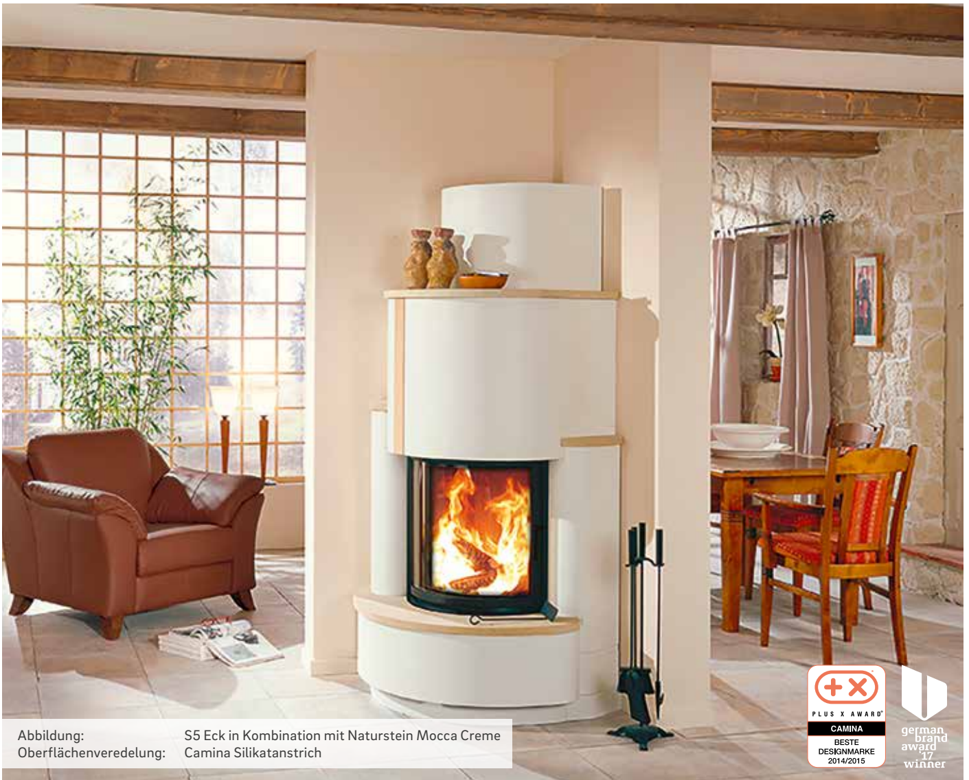
Abbildung: S5 Eck in Kombination mit Naturstein Mocca Creme Oberflächenveredelung: Camina Silikatanstrich