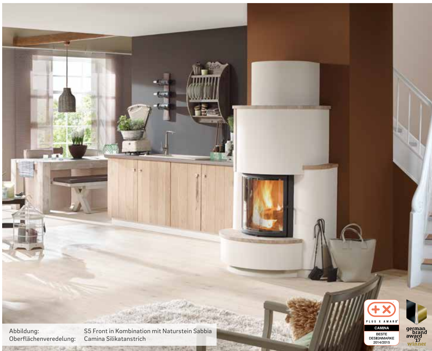
Abbildung: S5 Front in Kombination mit Naturstein Sabbia Oberflächenveredelung: Camina Silikatanstrich